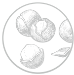
Good Sense Shea & Sandalwood Parfum Karité/boisé, senteur délicate douce et boisée