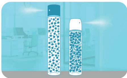
Technologie traditionnelle Nouvelle technologie compressée