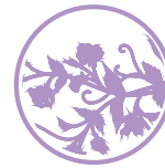
Good Sense Floral Ein leichter, blumiger Duft von süßen Blüten