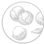
Good Sense Shea & Sandalwood Eine intensive Mischung aus Süße und delikatem Holzduft