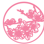
Good Sense Cherry Blossom Eine fruchtige Mischung aus Beeren und Frühlingsblüten