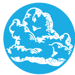
Good Sense Fresh Ein Duft von sauberem, frischem Leinen