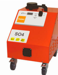
TASKI Steam SO4