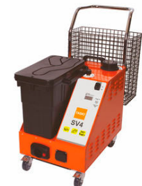
TASKI Steam SV4